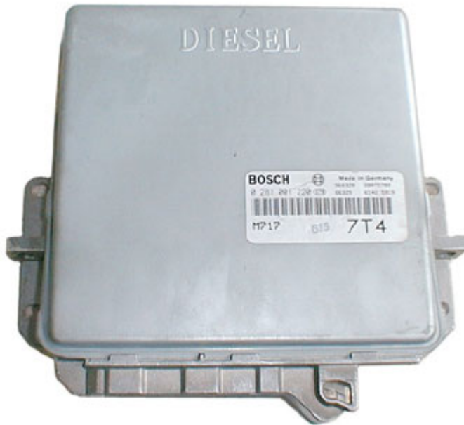
BOSCH MSA11 CENTRALINA MOTOR