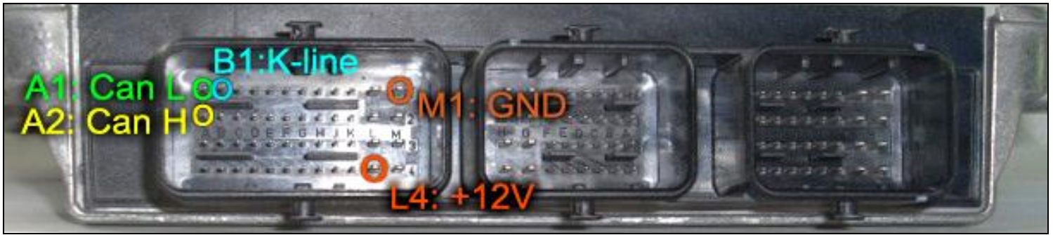
Figura 1: Pinout della centralina Jhonson Valeo / Pinout ECU Jhonson Valeo

FGTechnology Micro: ST10F273 Driver: ST10F273/5/6 BOOT MODE